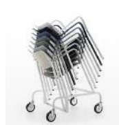
Chariot pour le rangement et le transport / BR