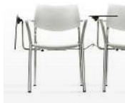
Tablette écriteire / BR Tablette écriteire en HPL démontable sans outils.