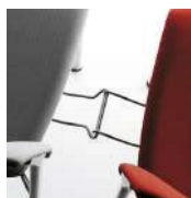
Pièce d'union / BR Pièce d'union téléscopique, dissimulée sous l'assise.