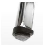
Patins feutre / BR