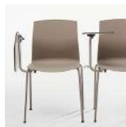
Tablette écriteire / KB Tablette écriteire en HPL facile à démonter.