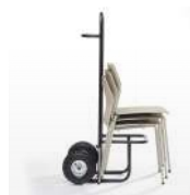
Chariot de rangement / KB